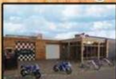
DCA Motorcycles entree

Ook voor onderhoud & reparatie van solo Bezoek ook eens onze uitgebreide showroom kleding • onderdelen • accessoires