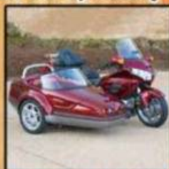
Dedome aan GI1800

Ook voor onderhoud & reparatie van solo Bezoek ook eens onze uitgebreide showroom kleding • onderdelen • accessoires