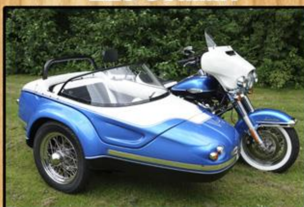
DEDÔME Type 70

Binnendijk 6 5705CH Helmond 0492-475500 DCAMOTORCYCLES.NL