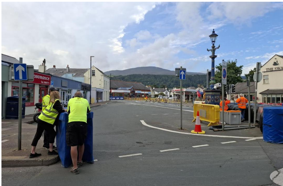
Hier in Ramsey met op de achtergrond de Mountain Road