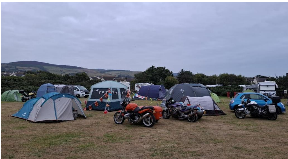
Op de camping in Peel

Om 24.00u kwamen we aan in de haven van Douglas en reden we naar Peel waar onze camping was, daar aangekomen vlug onze tent opzetten onder het genot van een biertje van onze buurman en buurvrouw uit Duitsland die wij Herr Akbar noemde en hij verstond gelukkig elk keer Herr Nachbar.