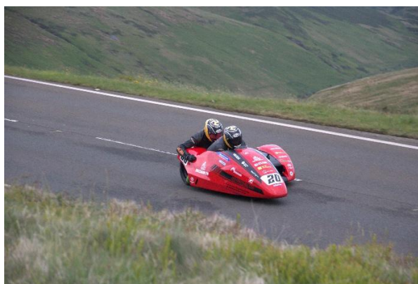
Mountainroad bij Bungalow (Roelof)