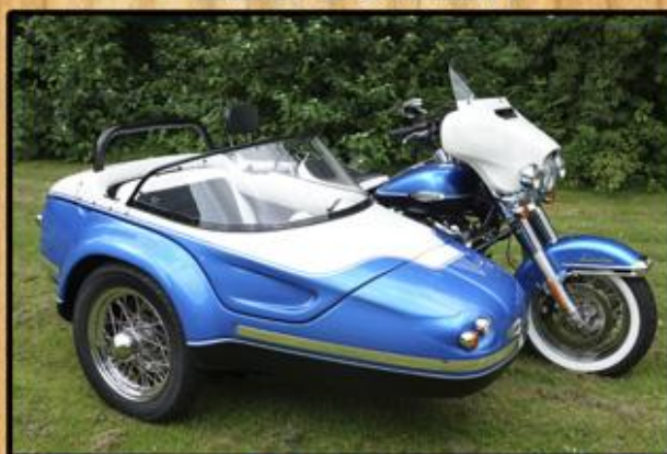
DEDÔME Type 70

Binnendijk 6 5705CH Helmond 0492-475500 DCAMOTORCYCLES.NL