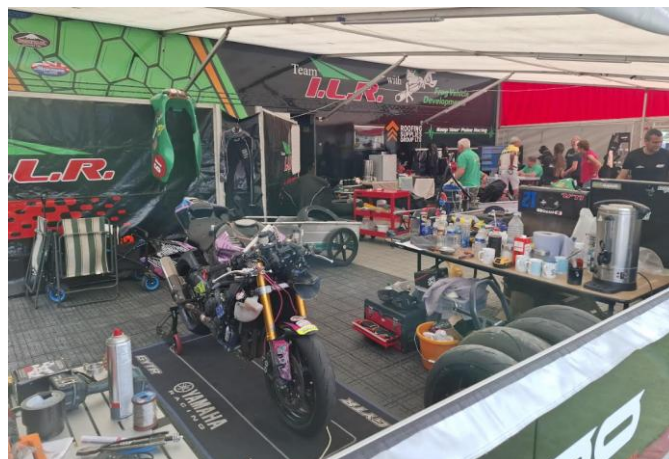
Een kijkje in het rennerskwartier

De volgende dagen brachten we door met motorrijden naar de Start en Finish in Douglas, of lang de kant gaan staan motorrace kijken in Ramsey, Kirk Michael, motor musea bezoeken.